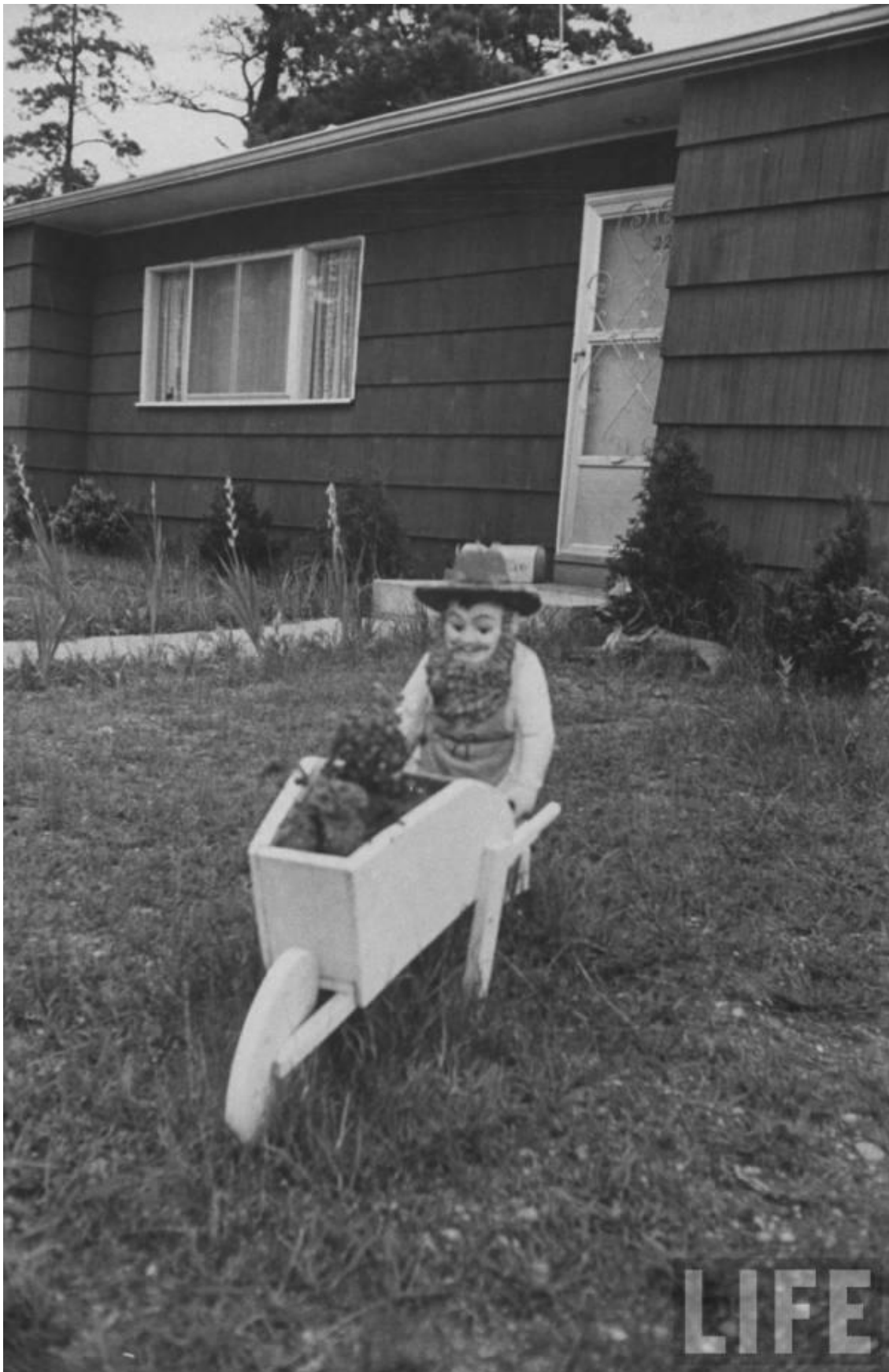
(Vivienda de Angelo LaMarca)