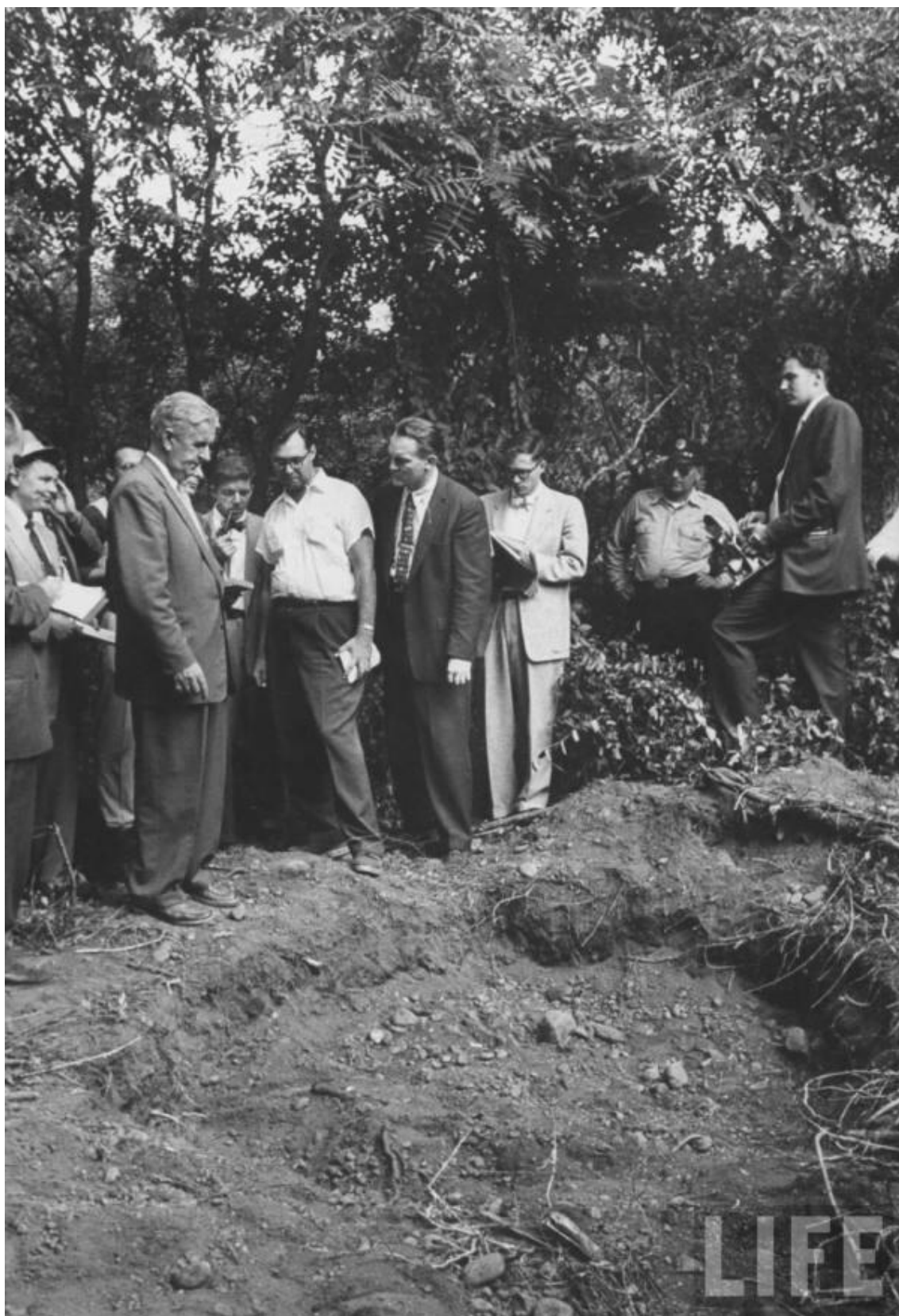
(Lugar dónde se encontraron los restos mortales del pequeño Weinberger)