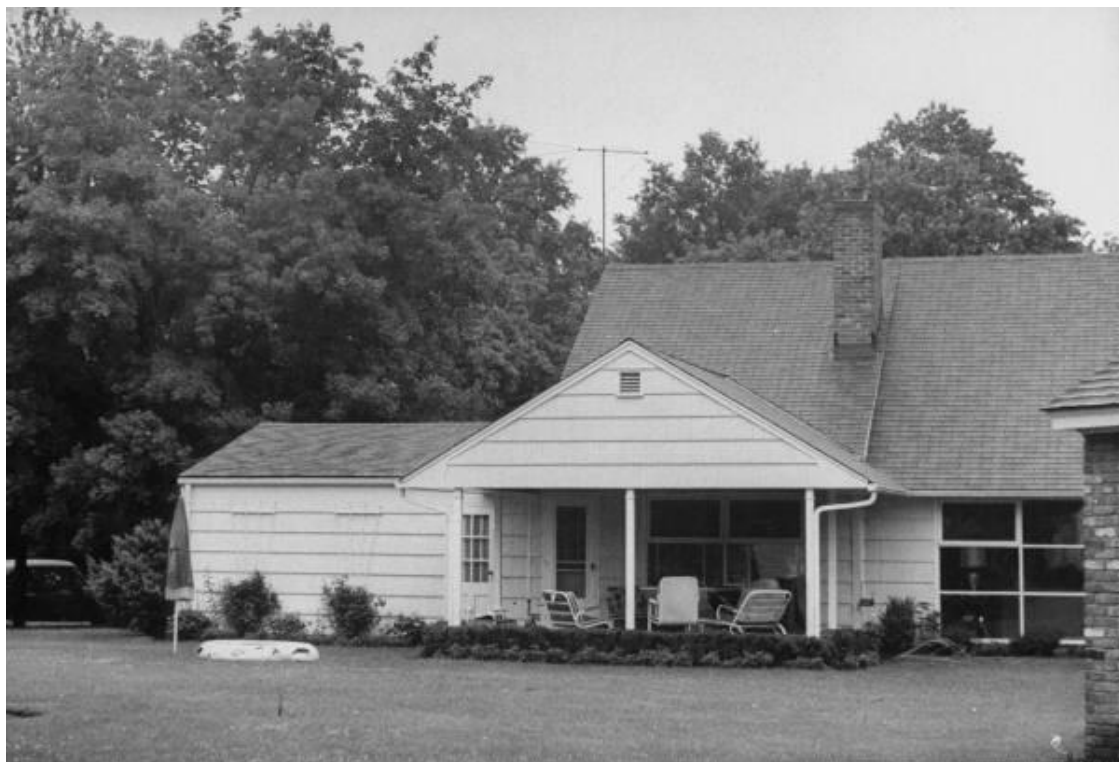
(Casa de la familia Weinberger, el pequeño se encontraba dentro de un carrito de bebé en el porche cuando fue secuestrado)