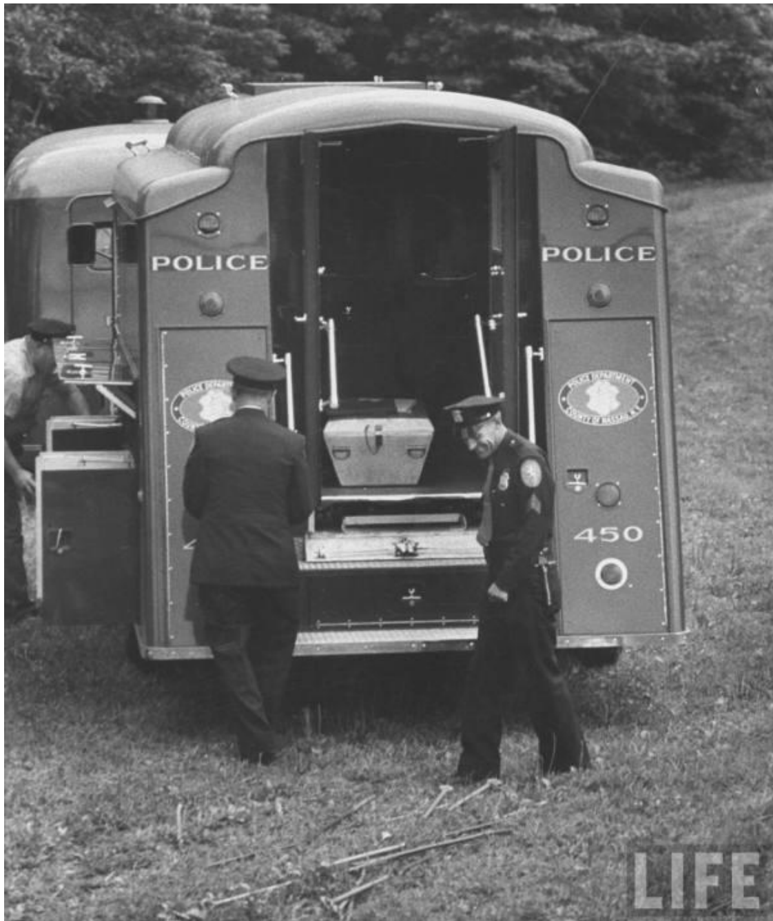
(Furgón policial en el lugar del hallazgo del cuerpo)